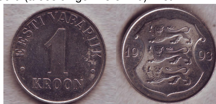
Afbeelding 28. Voor- en achterkant van de nieuwe Estlandse kroon.

De bevolking kon de roebels inwisselen tegen kronen tegen een koers van 10 roebel voor een kroon. Wie het bovenstaande staatje bestudeert, zal zien dat de posttarieven niet echt veranderden.