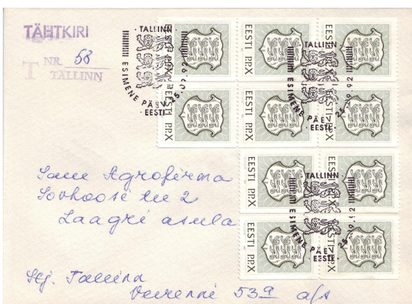
Afbeelding 31. Aangetekende brief van Tallinn naar Laagri, 25 september 1992. Op die datum kwam de postzegel uit die hier in tienvoud op de envelop is geplakt, met de code P.P. X. Het binnenlands tarief, waarvoor deze zegel bedoeld was, bedroeg toen 10 senti; het tarief voor een aangetekende brief bedroeg het tienvoudige. De zegels zijn vernietigd met het eerstedagstempel. Op de achterkant aankomststempel Laagri van 28 september 1992. Dit is de tweede oplaag van de P.P. X-zegel, die net weer iets anders is gekleurd dan de eerste van afbeelding 30. Ik laat de derde oplaag niet zien, maar die heeft weer een andere tint.